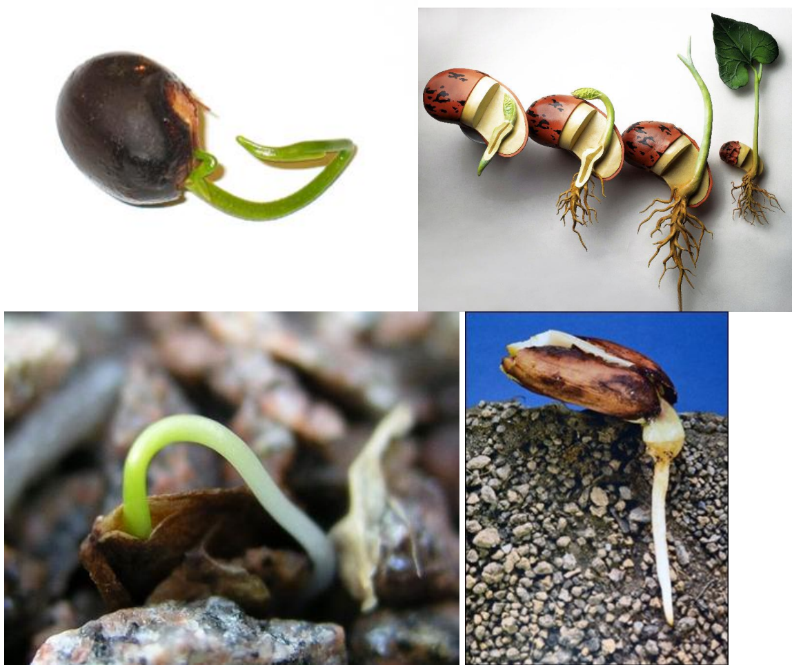
The art form from the natural sculpture.