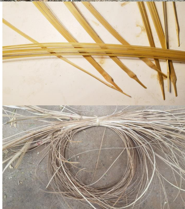
Study a local handicraft, local material and the way of life.