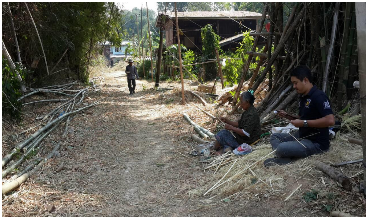
Learning handicraft knowledge with elderly people in the community.