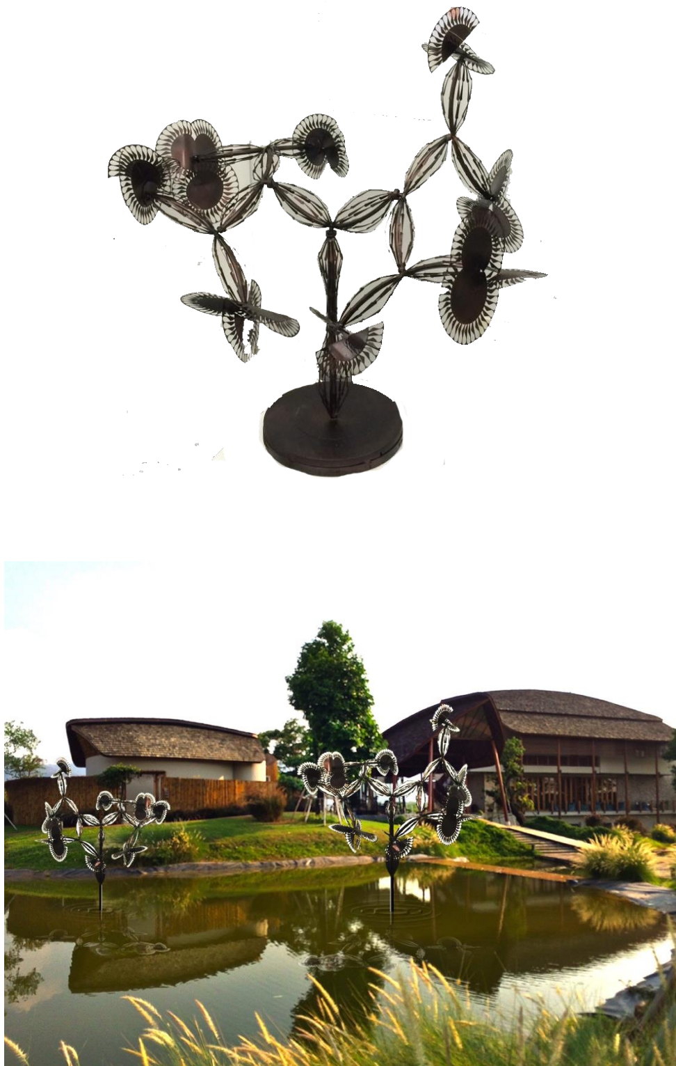
Image assumes installation work at the site.